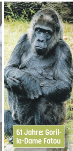
61 Jahre: Gorilla-Dame Fatou