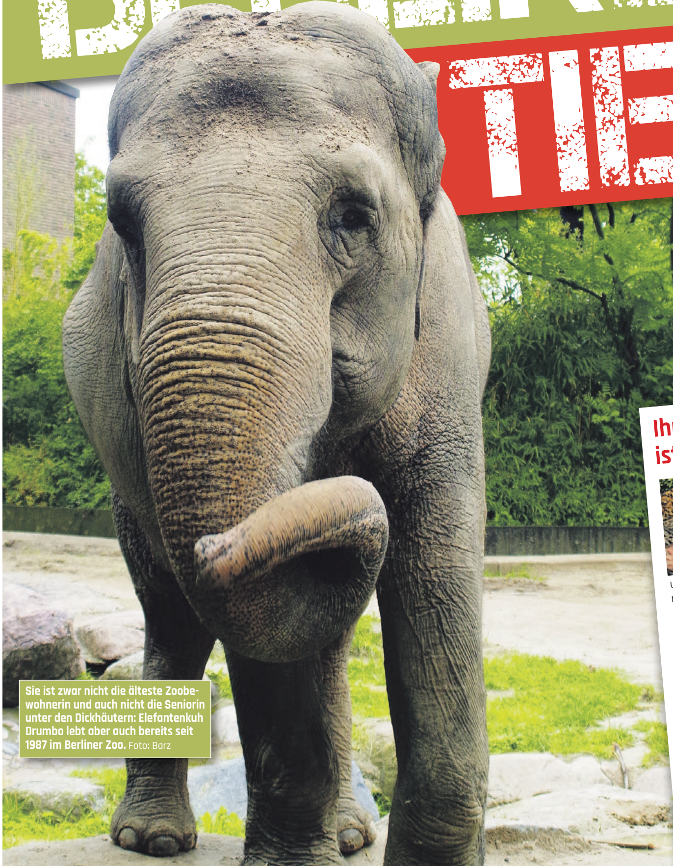
Sie ist zwar nicht die älteste Zoo- bewohnerin und auch nicht die Seniorin unter den Dickhäutern: Elefantenkuh Drumbo lebt aber auch bereits seit 1987 im Berliner Zoo.