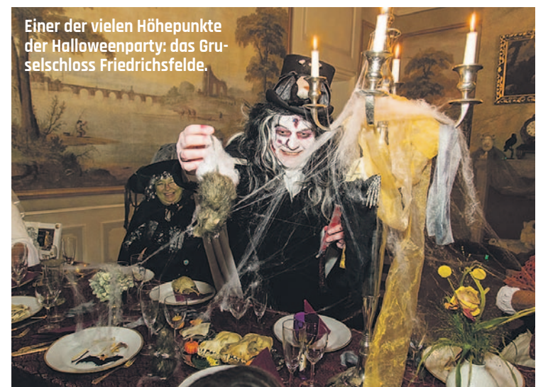
Einer der vielen Höhepunkte der Halloweenparty: das Gruselschloss Friedrichsfelde.

Gemeinsam mit dem Berlin Dungeon entführt Sie der Tierpark am 31. Oktober in die Welt von Hexen, Gespenstern & Co. und präsentiert ein einzigartiges Halloween-Programm für die ganze Familie. Dank großer Beliebtheit in den vergangenen Jahren, wird Halloween im Tierpark 2018 sogar noch aufregender und spektakulärer! Durch eine großzügige Erweiterung der Fläche und den Ausbau des aufregenden Programms dürfen Sie sich auf nie dagewesene Dimensionen freuen: Trauen Sie sich ab 17.30 Uhr auf die verlängerte Gruselroute? Bereits ab 12 Uhr wartet die Familienroute mit noch mehr interaktiven Stationen auf alle kleinen Grusel-Fans. Erleben Sie als ein neues Highlight eine einzigartige Show des Berlin Dungeon, bei der Sie zusammen mit ausgebildeten Schauspielern in die dunkle Welt von Grimms Märchen eintauchen. Natürlich prä-