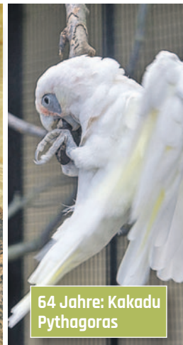
64 Jahre: Kakadu Pythagoras