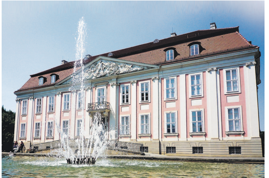
Barockes Kleinod mitten im Tierpark: Schloss Friedrichsfelde.

Tel.: (030) 51 53 14 07 info@schloss-friedrichsfelde.de sowie an allen Vorverkaufskassen