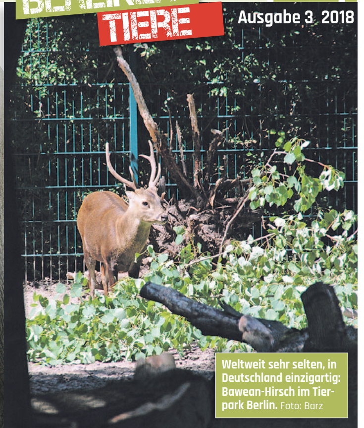
Weltweit sehr selten, in Deutschland einzigartig: Bawean-Hirsch im Tierpark Berlin.

Spendenkonto: Freunde Hauptstadtzoos Commerzbank IBAN: DE02 1204 0000 0912 9008 00 BIC: COBADEFFXXX Betreff: Artenschutzprojekt Spitzmaulnashorn