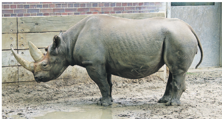
Eines von derzeit zwei Spitzmaulnashörnern im Berliner Zoo.

Kilogramm Kräuter bekommen sie täglich. Vom Dach strahlen in den Ställen UV-Lampen. Das sei ganz wichtig, sonst würden die Nashörner in europäischen Zoos eine mysteriöse Krankheit entwickeln, an der sie verbluten. „Dass sie eigentlich sehr schutzbedürftig sind, sieht man diesen kräftigen Tieren nicht an“, sagt Ochs. Interessant seien ebenso, die völlig verschiedenen Charaktere, die er an sei-