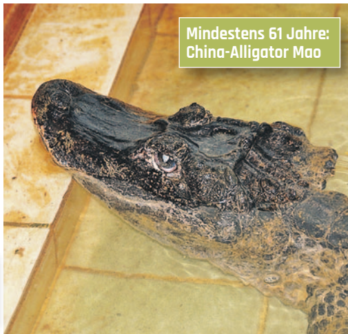
Mindestens 61 Jahre: China-Alligator Mao